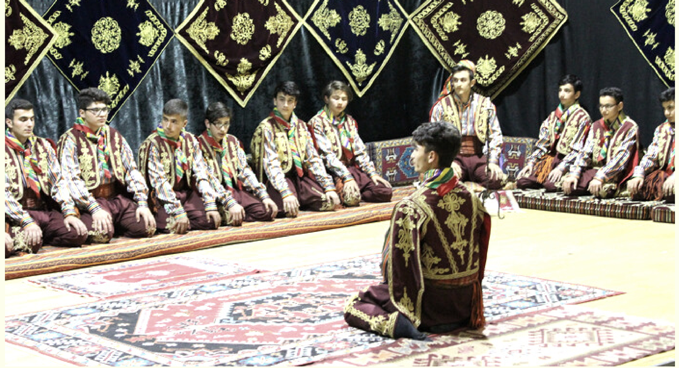
Okul Yaren Ekibi